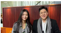
学生与香港立法会议员一同合影留念