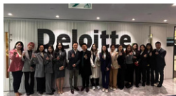
优秀学员被邀请前任德勤（香港办公室）与合伙人交流访问