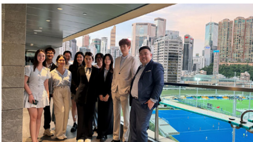
优秀学员与企业总监被邀请出席香港赛马会晚宴合影留念