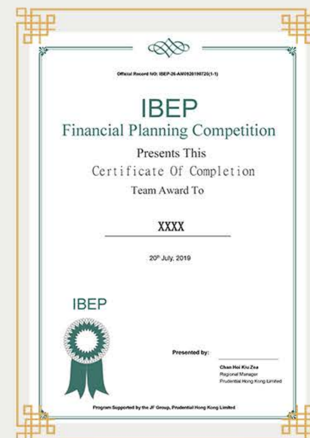
理财策划书大赛 (获奖团队)