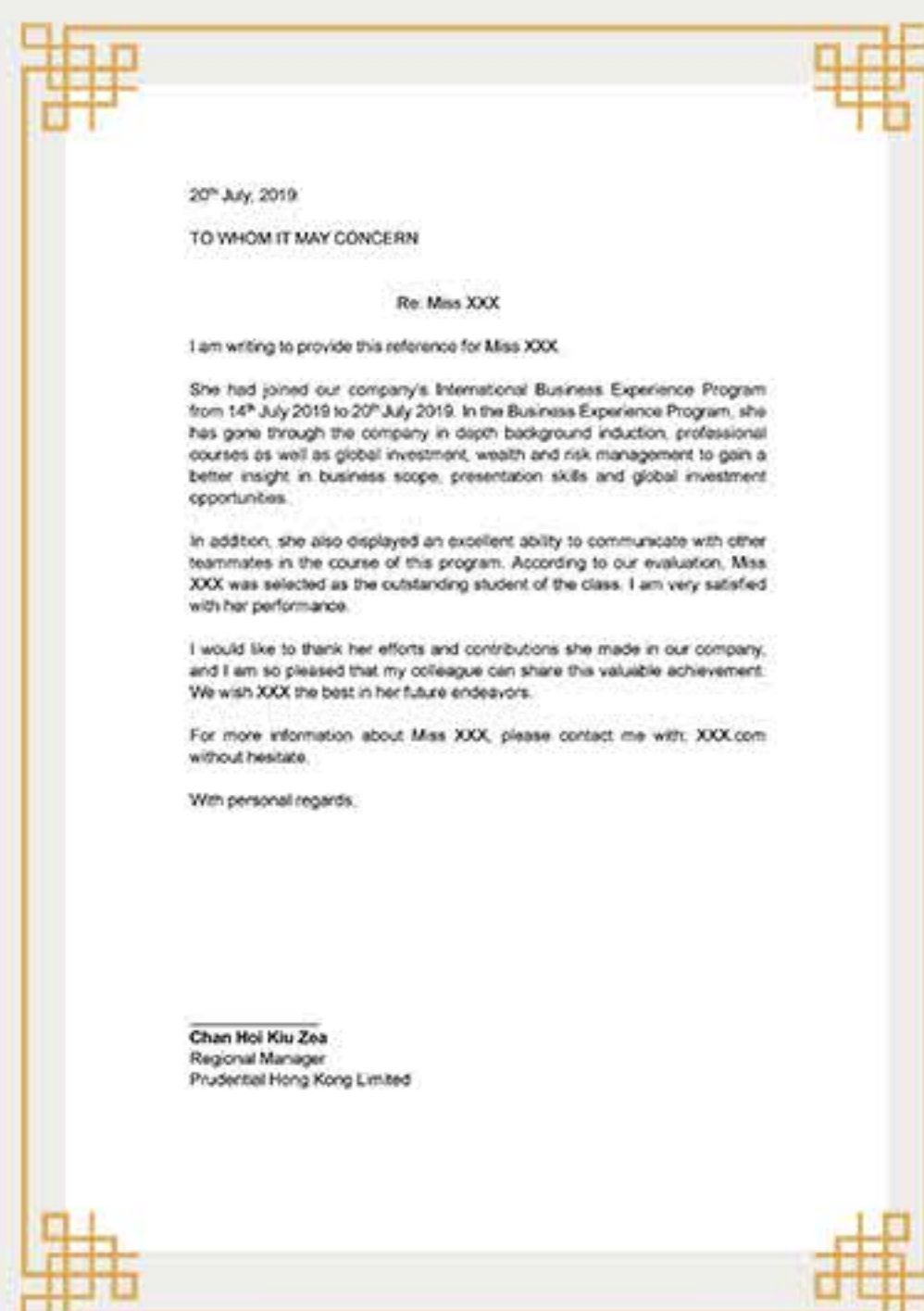
名企高层个人推荐信 (表现优异学员)