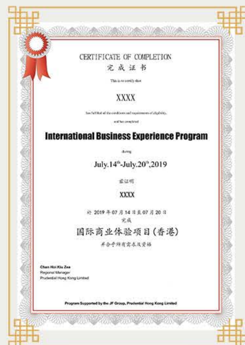
名企管培生邀请函 (表现优异学员)