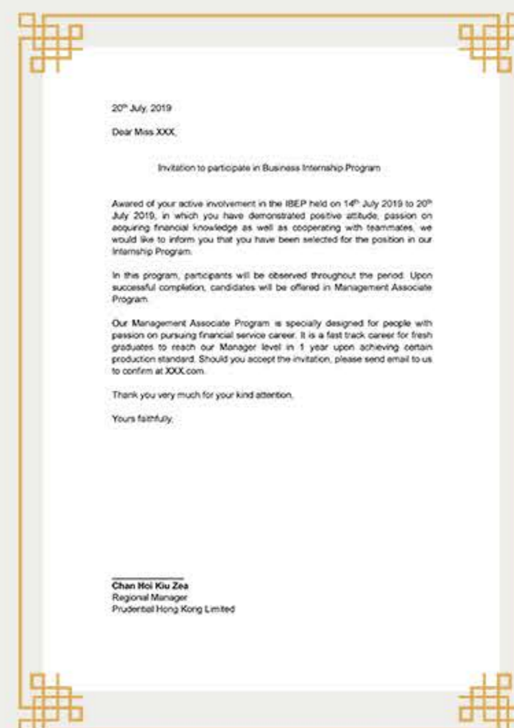
名企项目完成证书