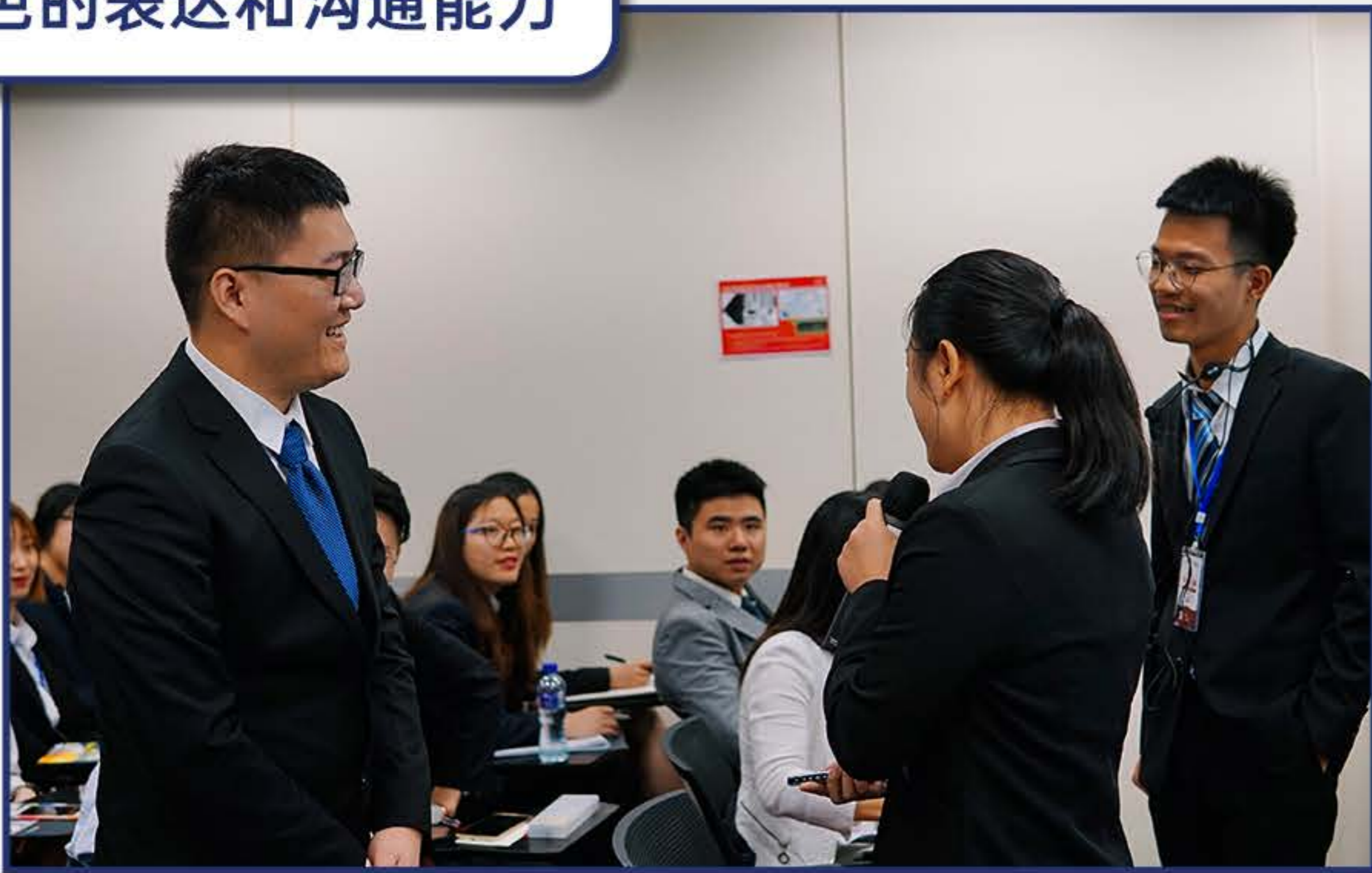
出色的表达和沟通能力